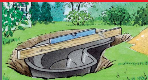
Umetanje i poravnavanje AL-KO bazenčića za ribnjak