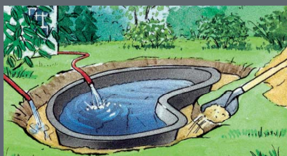
Slobodne prostore oko bazenčića za ribnjak napunite pijeskom