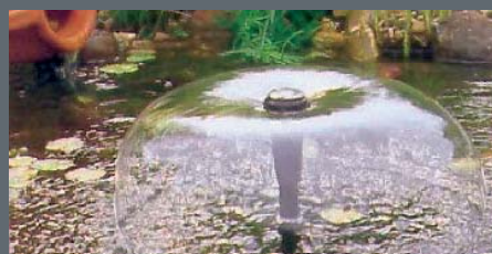
Fontana u obliku zvona