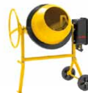
TOP 1403 HR