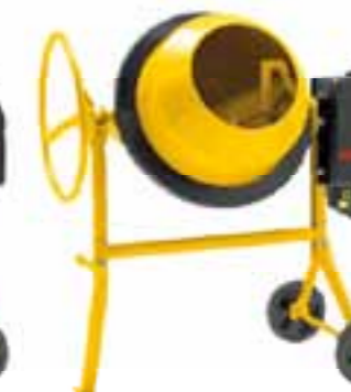
TOP 1402 HR