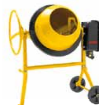
TOP 1402 KT